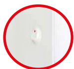
INTERRUPTEUR LED «ÉCLAIRAGE»