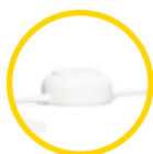
INTERRUPTEUR LOD «DÉSINFECTION»