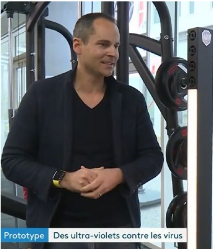
en salle de sport