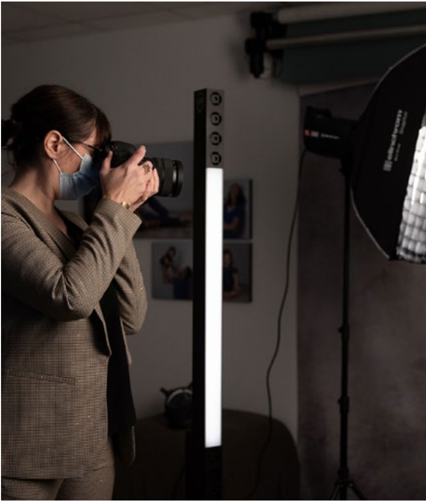
en séance photo