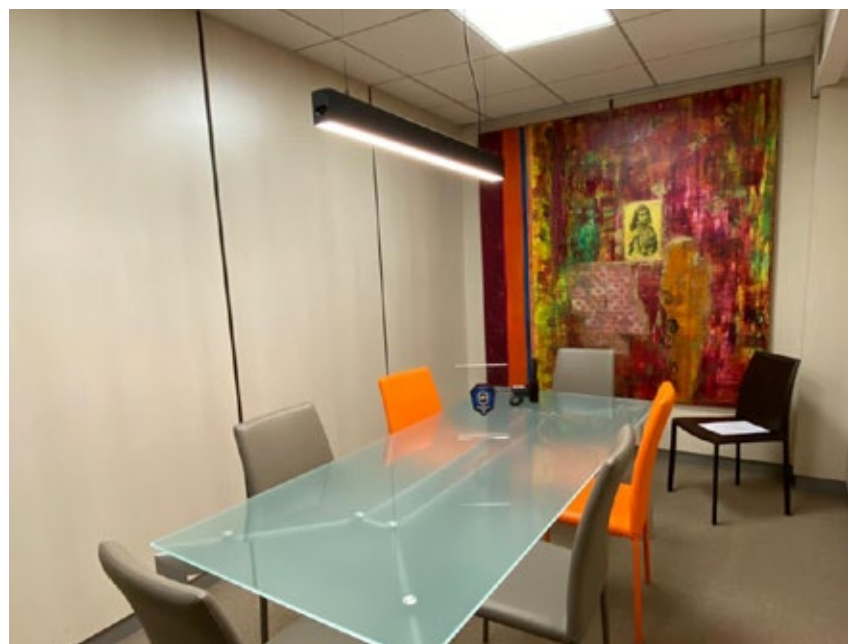
en salle de réunion